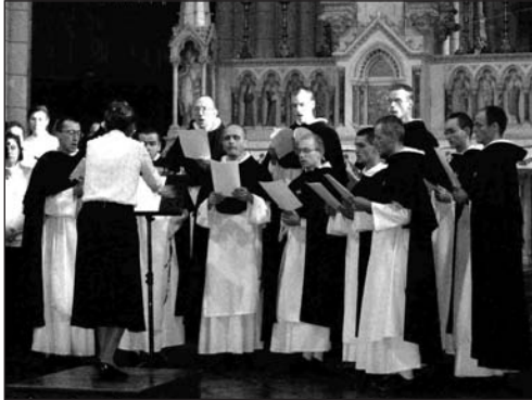
Journées grégoriennes de Nantes