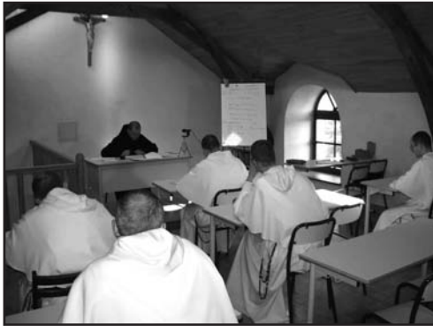
Cours de Patristique

agrémentée par la rencontre d'un éleveur qui nous fait visiter son exploitation et goûter à ses productions.