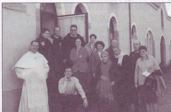
Tertiaires avec leur chapelain

◇ 8-9 mars : une quinzaine de Tertiaires se retrouvent au Couvent pour une récollection de Carême. Le thème, en cette année du Rosaire, tourne autour des mystères de lumière. Un diaporama, réalisé par le Frère Vincent-Marie, vient les illustrer heureusement.