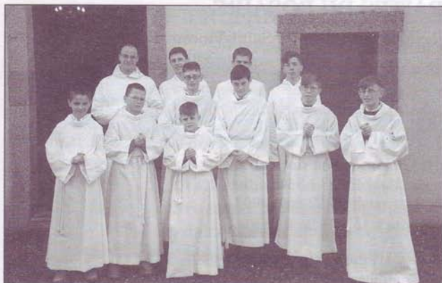
Servants de messe le 2 février