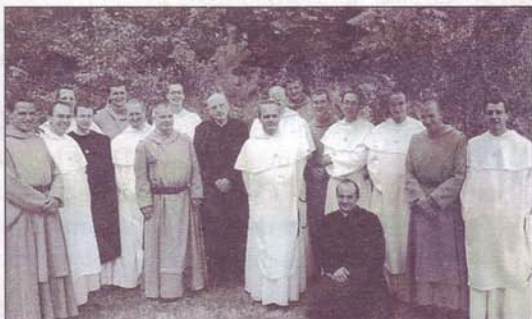
Deux Communautés réunies

✧ Du 1 er au 5 août, retraite de communauté multicolore : les Frères de Riaumont viennent se joindre à nous pour profiter de la grande expérience du Père Paisant, religieux